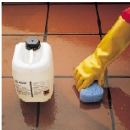
Czyszczenie za pomocą KERANET'u ciekłego