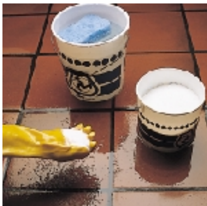
Czyszczenie za pomocą KERANET'u w proszku